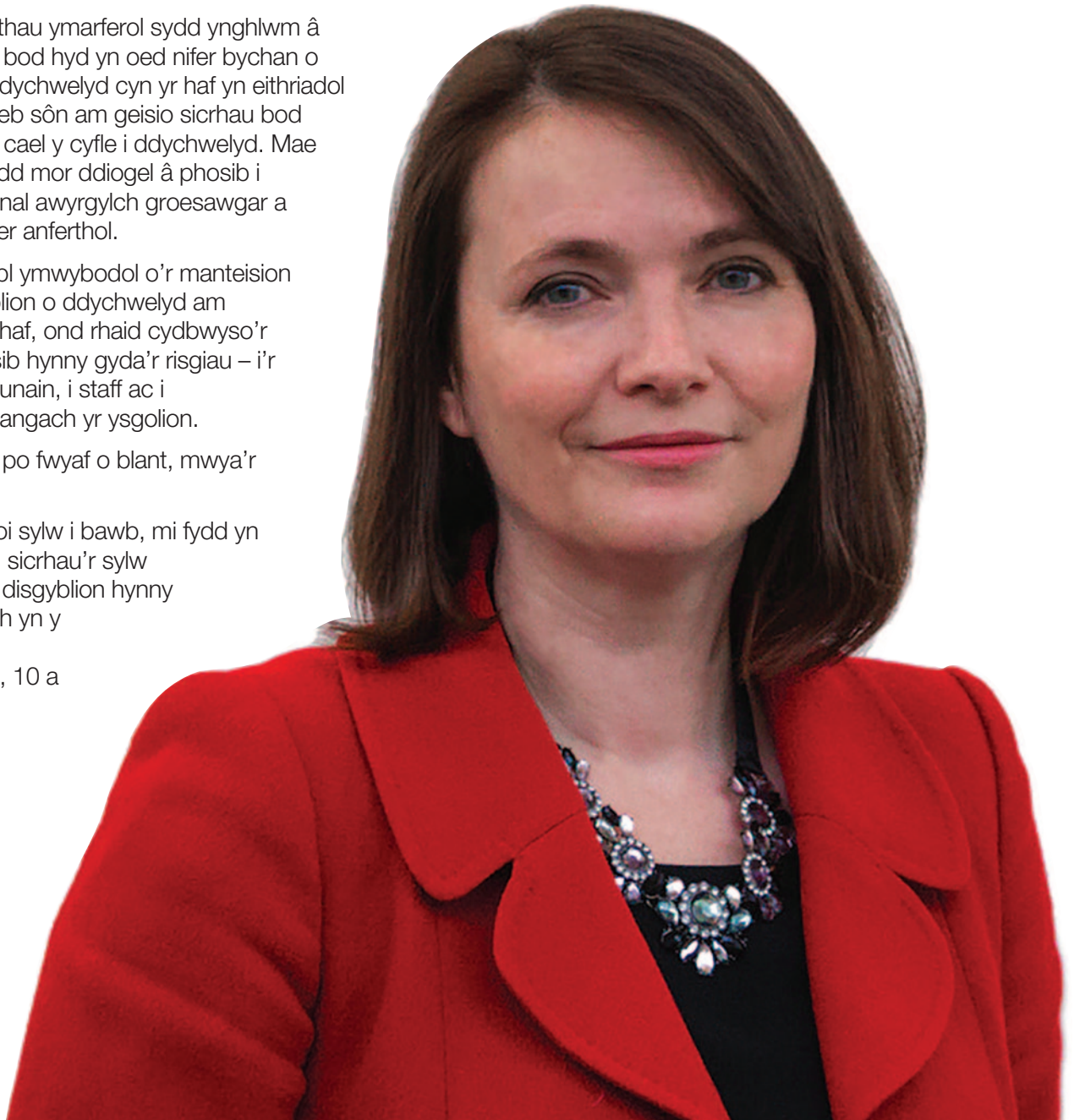
Kirsty Williams AS, Y Gweinidog Addysg

Cofiwch os oes gennych chi unrhyw bryder neu broblem, cysylltwch â ni i drafod: ucac@ucac.cymru 01970 639950